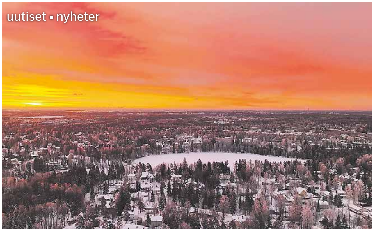
Kaunis valo Kauniaisten ja Gallträskin yllä. Kuva kevättalvelta 2024. Vackert sken över Grankulla och Gallträsk. Bilden från vårvintern 2024.