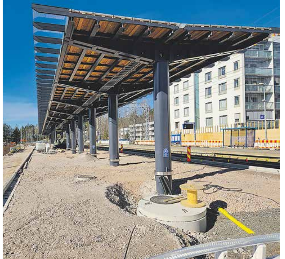
Koivuhovin juna-asemasta 21.3. Kuvasuunta on länteen. Välilaiturin vasemmalle puolelle tulee uudet kiskot, jolla liikennöinti itään alkaa kesäkatkon jälkeen.