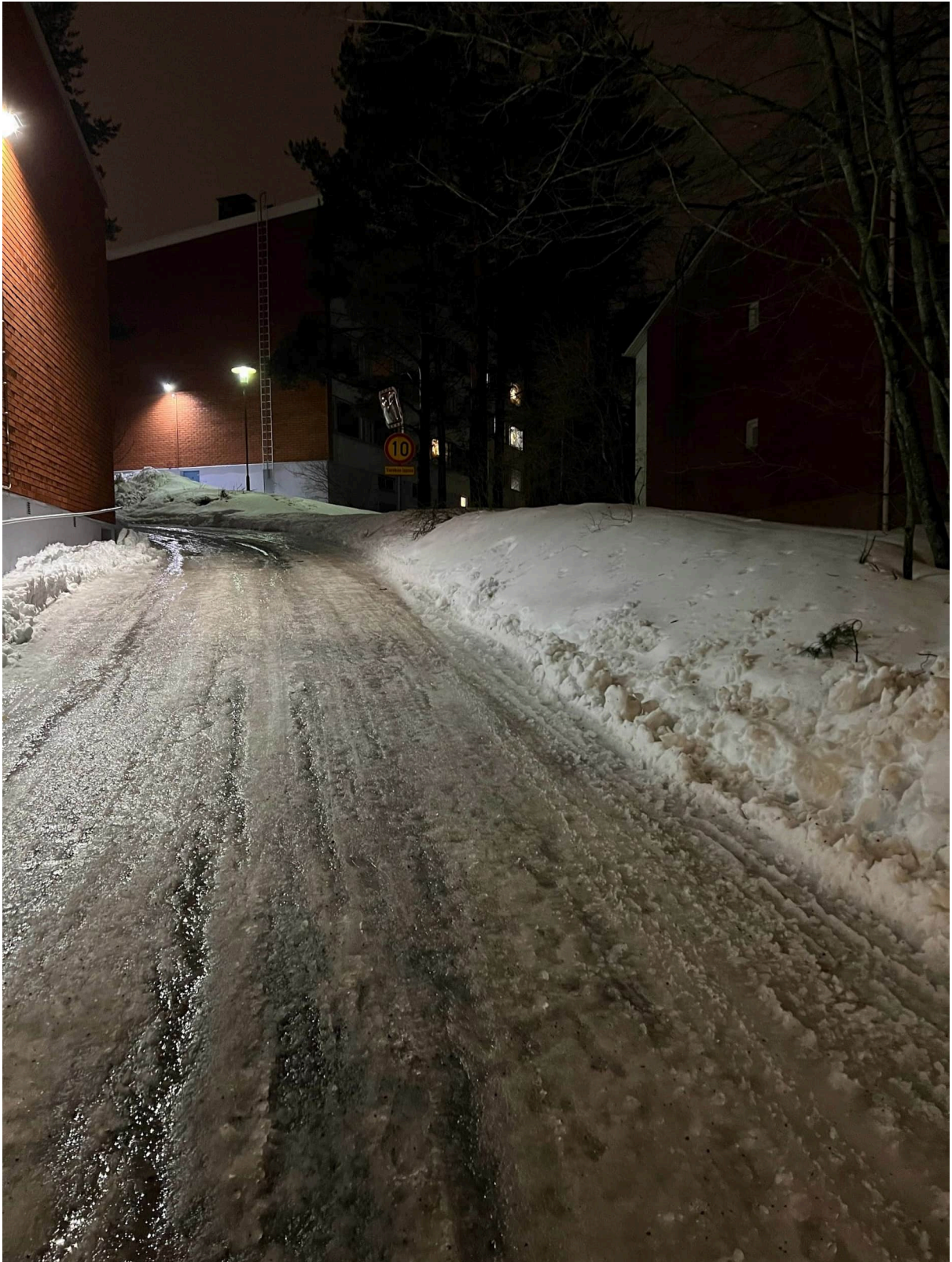
Kuva 4. Ajoluiska ja oikealla pengeri.