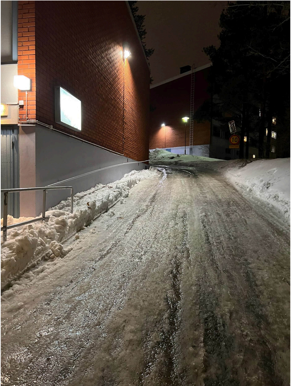
Kuva 3. Ajoluiska ja kaide vasemmalla.