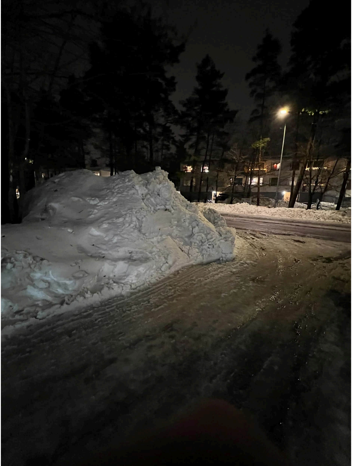
Kuva 5. Näkyvyys Urheilutielle pihalta/ajoluiskalta katsottuna kun lunta on kasattu risteykseen.