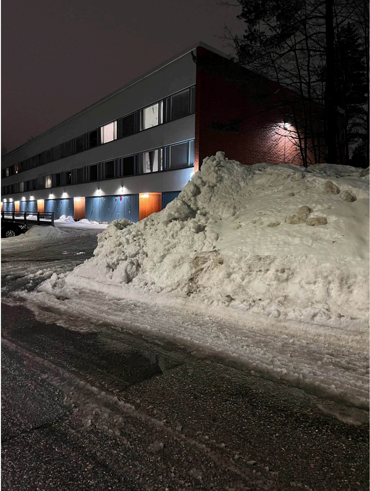
Kuva 6. Näkyvyys Urheilutieltä katsottuna.