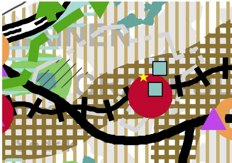
Kuva 2. Ote Uusimaa 2050 -kaavasta. Kaava-alueen likimääräinen sijainti esitetty keltaisella tähdellä.

Uusimaa-kaava 2050:ssä alue sijoittuu taajamatoimintojen kehittämisvyöhykkeeseen ja pääkaupunkiseudun ydinvyöhykkeeseen. Suunnittelualue sijaitsee Kauniaisten keskustan välittömässä läheisyydessä, joka on osoitettu merkinnällä "keskustatoimintojen alue, keskus".