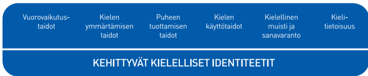
Kuvio 2. Lasten kielen kehityksen keskeiset osa-alueet varhaiskasvatuksessa

Vuorovaikutustaitojen kehittymisen kannalta lasten kokemukset kuulluksi tulemisesta ja siitä, että heidän aloitteisiinsa vastataan, ovat tärkeitä. Henkilöstön sensitiivisyys ja reagointi myös lasten non-verbaaleihin viesteihin on keskeistä. Vuorovaikutustaitojen kehittymistä tuetaan kannustamalla lapsia kommunikoimaan toisten lasten ja henkilöstön kanssa.