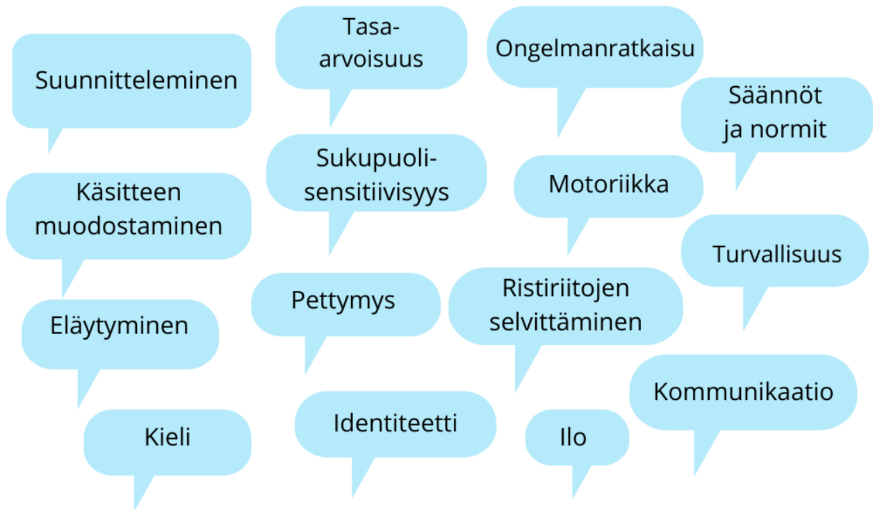
Paikallinen kuvio 2. Leikin merkitys