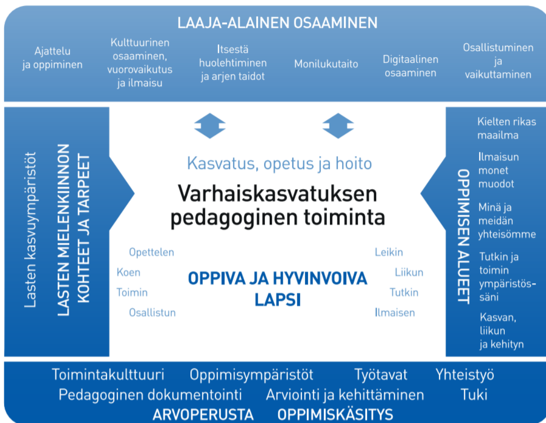
Kuvio 1. Varhaiskasvatuksen pedagogisen toiminnan viitekehys

Varhaiskasvatuksen pedagogista toimintaa ja sen toteuttamista kuvaa kokonaisvaltaisuus. Tavoitteena on edistää lasten oppimista ja hyvinvointia sekä laaja-alaista osaamista (kuvio 1). Pedagoginen toiminta toteutuu lasten ja henkilöstön välisessä vuorovaikutuksessa ja yhteisessä toiminnassa. Lasten omaehtoinen, henkilöstön ja lasten yhdessäideoima sekä henkilöstön suunnittelema toiminta täydentävät toisiaan. Varhaiskasvatuksen pedagoginen toiminta läpäisee kasvatuksen, opetuksen ja hoidon kokonaisuuden.