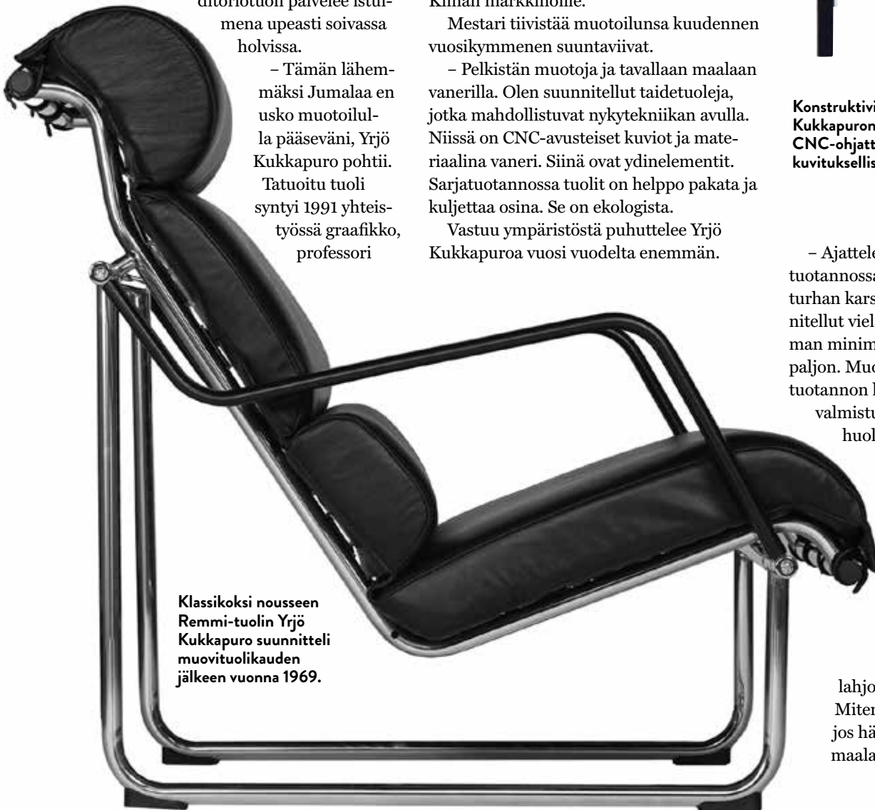
Klassikoksi nousseen Remmi-tuolin Yrjö Kukkapuro suunnitteli muovituolikauden jälkeen vuonna 1969.