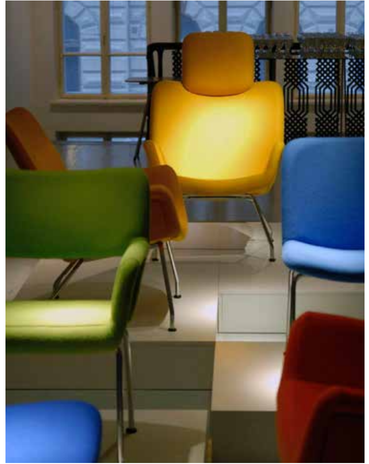
Moderno-ryhmä vuodelta 1956 on vanhin edelleen tuotannossa oleva Yrjö Kukkapuron mallisto.