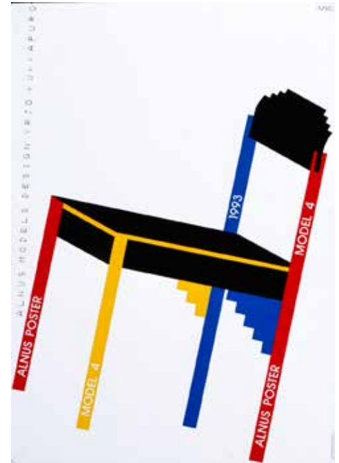
Yrjö Kukkapuro toteutti tuolin Tapani Aartomaan Alnus Poster -julisteen mukaan. Tuoleja tehtiin 39 numeroitua kappaletta.