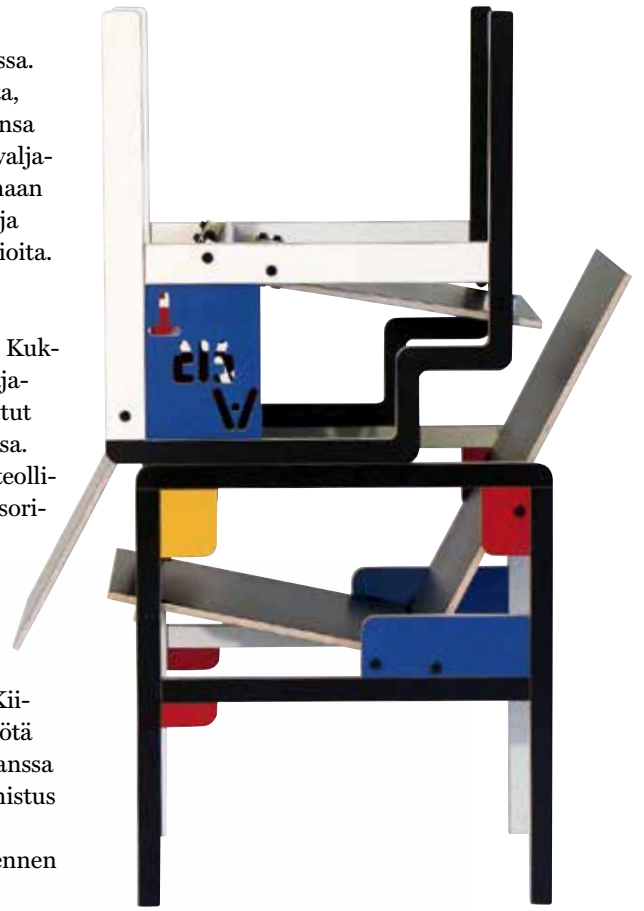
Konstruktivistiset taidetuolit kuuluivat Yrjö Kukkapuron aluevaltauksiin 2000-luvulla. CNC-ohjattu tekniikka mahdollistaa mielenkiintoiset muodot ja värit.

Vastuu ympäristöstä puhuttelee Yrjö Kukkapuroa vuosi vuodelta enemmän.