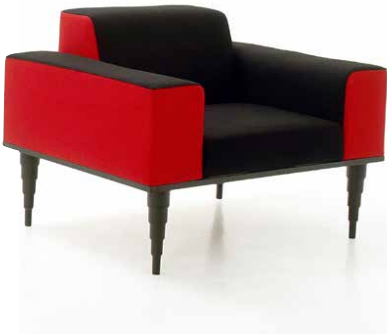
Punamusta Variaatio-nojatuoli. Yrjö Kukkapuro lisäsi mukavaan oleilutuoliin postmodernia tyyliä henkivän jalkarakenteen vuonna 1982.