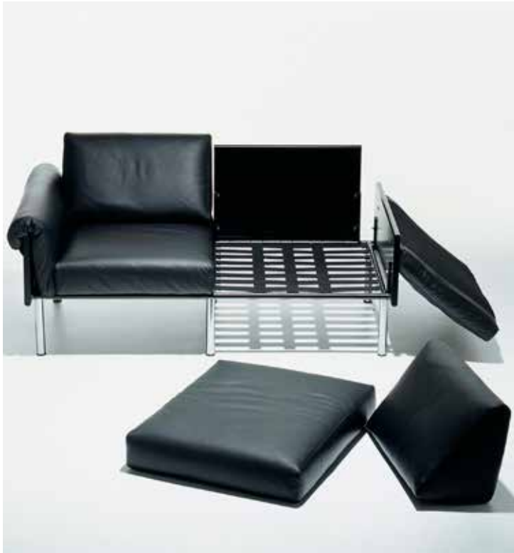
Ateljee-sarja vuodelta 1964. Sen runko koostuu yhteen liitettävistä komponenteista, joita voi liittää yhteen miten monta tahansa. "Vaikka maailman ympäri", Yrjö Kukkapuro vannoo.