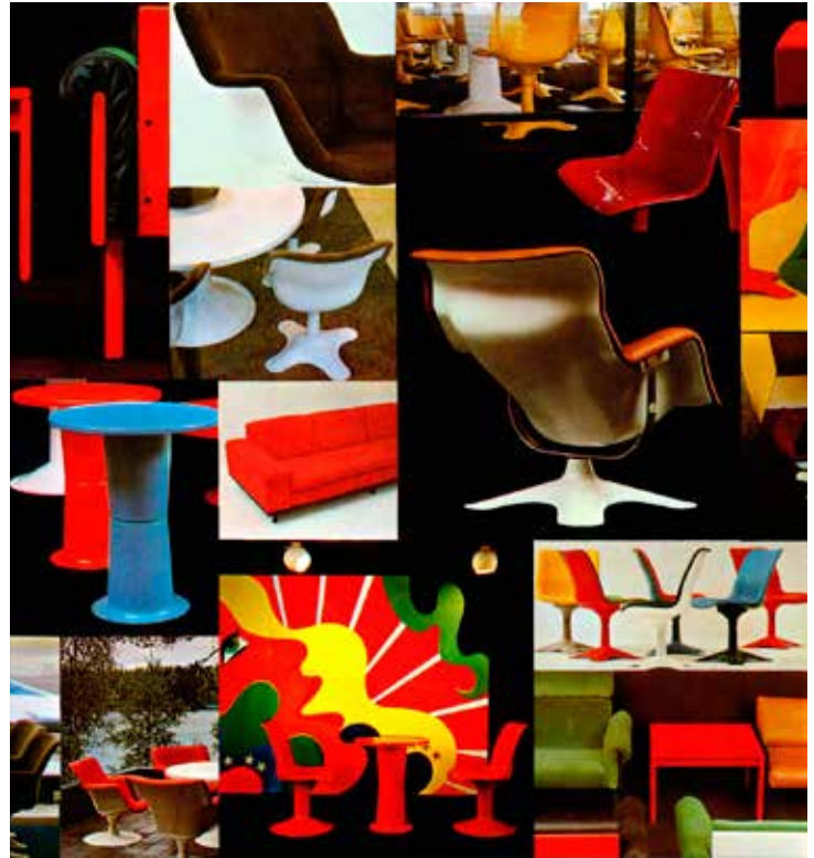
Haimi Oy:n pop-taiteellinen myyntikatalogi on vuodelta 1967. Sen värikkäaseen kanteen on kuvattuna muun muassa Karuselli-tuoli, Saturnus-pöytä, Junior-nojatuoli sekä tuolit 416 sekä 415.