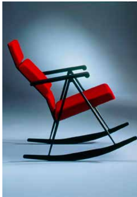
Funktus-sarjan keinutuoli kuului julkisen tilan sarjaan, mutta sopii myös kotikäyttöön. Sama pätee moniin muihin julkiskalustesarjoihin.