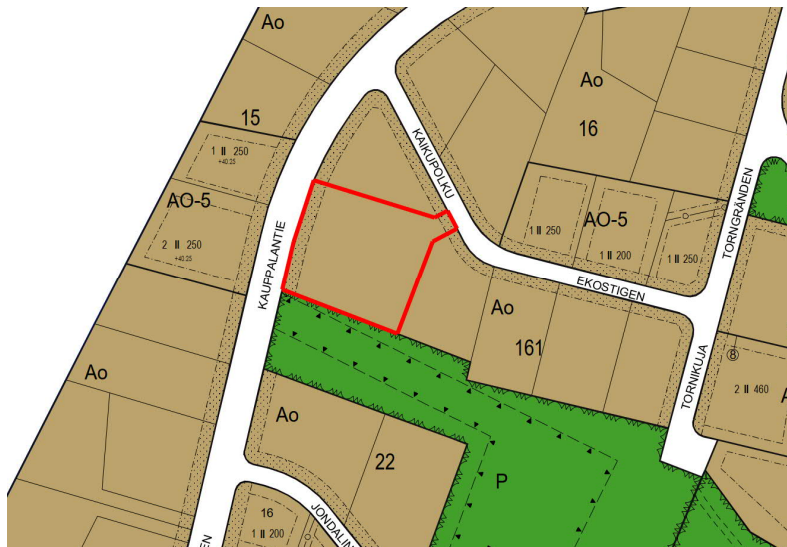
Kuva 3. Ote Kauniaisten asemakaavojen yhdistelmäkartasta.

Suunnittelualueella on voimassa sisäasiainministeriön 12.11.1964 vahvistama asemakaava (Ak 33), jossa tontti on osoitettu enintään kaksihuoneistoisten asuintalojen korttelialueeksi (Ao). Asemakaavan mukaan tontille saa sijoittaa yhden enintään kaksi asuinhuoneistoa käsittävän ja enintään kaksikerroksisen päärakennuksen peittoalaltaan enintään 350 m 2 . Lisäksi alimmaiseksi saa rakentaa enintään 2,1 metriä korkeita huonetiloja talon omaan käyttöön, kuten taloustiloja ja autotalleja. Tämän lisäksi tontille saa sijoittaa enintään 75 m 2 :n suuruisen yksikerroksisen talousrakennuksen talonmiehen asuntoineen. Tontin kokonaisrakennusoikeus on 775 k-m 2 ja sallittu peittoala 425 m 2 .