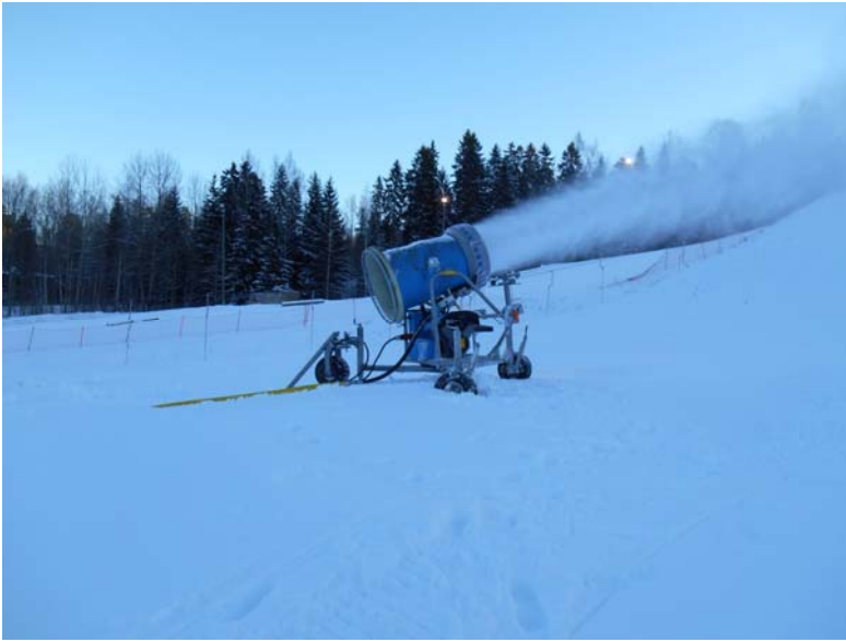
Kuva 2. Vuoden 2016 mittauksen aikana rinteän yläosassa ollut puhallinlumitykki (kuva 5.1.2017).