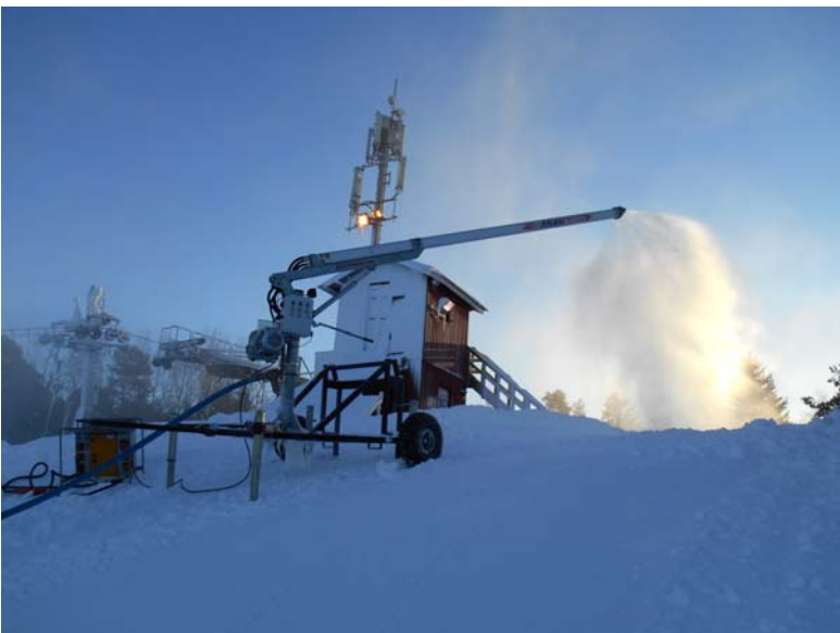
Kuva 1. Vuoden 2017 mittauksen aikana rinteän yläosassa ollut hybridilumitykki (kuva 5.1.2017).

Kuvassa 1 on esitetty nyt tehdyn mittauksen aikana rinteän yläosassa alueella 1 ollut hybridilumitykki. Tykissä ei ole puhallinta ja sen melupäästö on puhallinlumitykkiä alhaisempi. Mittausten aikana hybridilumitykin käyttöasetus oli 2/3. Veden syöttöjärjestelmän paine ei riitä asetukselle 3/3. Mittausten aikana rinteän keskiosassa ja alaosassa oli toiminnassa puhallinlumitykki. Kuvassa 2 on esitetty lumitykki, joka vuoden 2016 mittauksen aikana oli rinteän yläosassa ja nyt alaosassa.