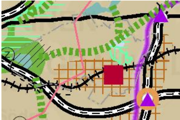
Kuva 2. Ote Uudenmaan voimassa olevien maakuntakaavojen yhdistelmäkartasta 2019 (Uudenmaan liiton karttapalvelu).

Ympäristöministeriön 8.11.2006 vahvistamassa Uudenmaan maakuntakaavassa suunnittelualue on osoitettu taajamatoimintojen alueeksi. Vireillä olevassa Uusimaa-kaava 2050 –ehdotuksessa suunnittelualue kuuluu taajamatoimintojen kehittämisvyöhykkeeseen.