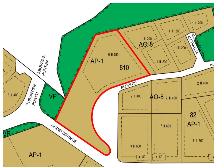
Kuva 3. Ote Kauniaisten asemakaavojen yhdistelmäkartasta.

Suunnittelualueella on voimassa ympäristöministeriön 19.1.1990 vahvistama asemakaava (Ak 108), jossa alue on osoitettu asuinpienalojen korttelialueeksi (AP-1). Alueen pohjoisosaan on osoitettu rakennusala ja rakennusoikeutta kuudelle asunnolle korkeintaan kahteen kerrokseen, yhteensä enintään 750 k-m 2 (6 II 750).